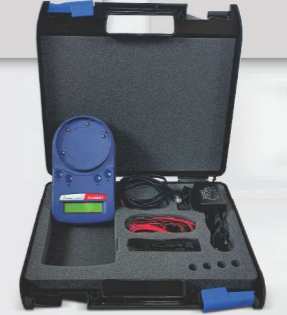
FC-490-ST Programmerunit FC-490ACC-KIT Service koffer Voor het adresseren en uitlezen van alle FireClass lus-elementen.