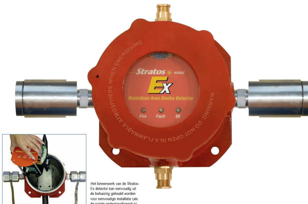
Het binnenwerk van de Stratos-Ex detector kan eenvoudig uit de behuizing gehaald worden voor eenvoudige installatie (als de ruimte gedeclareerd is).